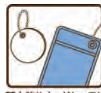
革小物やカードケースに